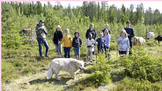
Fäbodkollo 2025