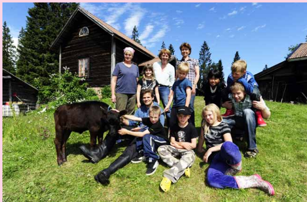
Första Fäbodkollo 2010

Programmet inleds kl. 11.00 och avslutas kl. 15.00